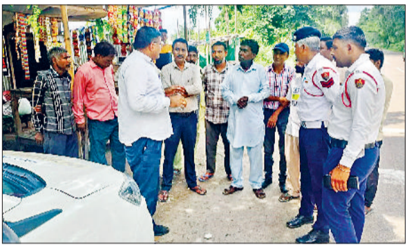
फतेहाबाद। रिक्शा चालकों को ट्रेफिक नियमों की जानकारी देते पुलिस कर्मचारी।