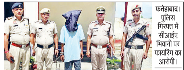
फतेहाबाद। पुलिस गिरफ्तार में सीआईए मिवाणी पर फायरिंग का आरोपी।