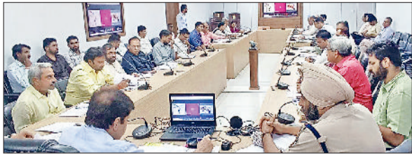
सिरसा। अधिकारियों की बैठक लेते एडीसी।

समाधान शिविर आमजन की जन समस्याओं के समाधान का सशक्त माध्यम है। जहां आमजन को एक छत के नीचे सभी प्रकार की समस्याओं को रखने का अवसर मिलता है। लोगों की समस्याओं का जल्द से जल्द हल हो, जिससे उन्हें ज्यादा से ज्यादा सरकारी योजनाओं का लाभ मिले। इसी उद्देश्य के साथ सभी विभागाध्यक्ष समाधान शिविर की शिकायतों का प्राथमिकता से