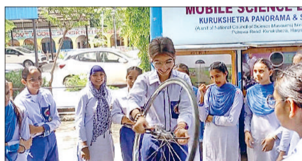
रतिया। पीएम श्री राजकीय व.मा. विद्यालय नागपुर में विज्ञान प्रदर्शनी में भाग लेते विद्यार्थी।

कुरुक्षेत्र पैनोरमा एवं विज्ञान केन्द्र, कुरुक्षेत्र के मोबाइल साइंस आउटरीज प्रोग्राम के अंतर्गत जिला शिक्षा विभाग फतेहाबाद तथा पैनोरमा की सहकार्यता से गांव नागपुर स्थित पीएम श्री राजकीय वरिष्ठ माध्यमिक विद्यालय में विज्ञान प्रदर्शनी एवं विज्ञान कार्यक्रम का आयोजन किया गया। दो दिवसीय इस कार्यक्रम में विद्यार्थियों ने उत्साहपूर्वक भाग लिया। कार्यक्रम