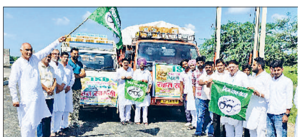
सिरसा। इनेलो जिलाध्यक्ष पंजाब बाढ़ पीड़ितों की सहायता के लिए राहत सामग्री