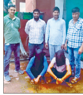
फतेहाबाद। गिरफ्तार दोनों युवक।

भिरडाना के रूप में हुई है। इससे पहले इसी मामले में एक अन्य आरोपी को पहले ही काबू किया जा चुका था। सीआईए रतिया प्रभारी एएसआई रिछाल ने बताया कि इस बारे पुलिस ने 31 अगस्त को थाना सदर रतिया में केस दर्ज किया गया था।