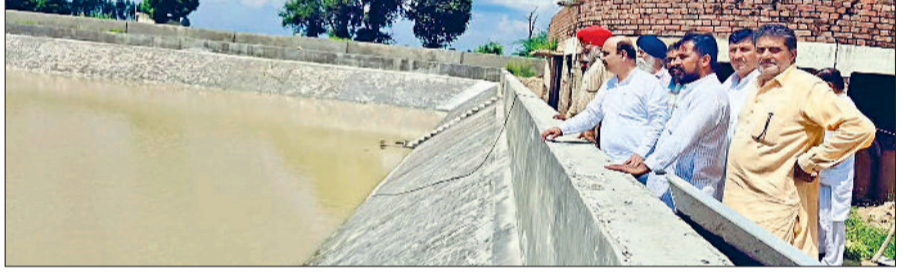
देगा, जो कि अगले माह तक सप्लाई शुरूआत करवा दी जाएगी। जोड़ा ने कहा कि भाजपा सरकार संकल्पबद्ध होकर हर घर जल हर घर नल के तहत पानी पहुंचाने में लगी हुई है। भाजपा सरकार के नेतृत्व में पूरे

शहरों की तर्ज पर ग्रामीण क्षेत्रों का विकास कार्य किया जा रहा है। आने वाले समय में हमारा प्रदेश विकसित भारत के सपने को पूरा करने में अहम भूमिका निभाता नजर आएगा।